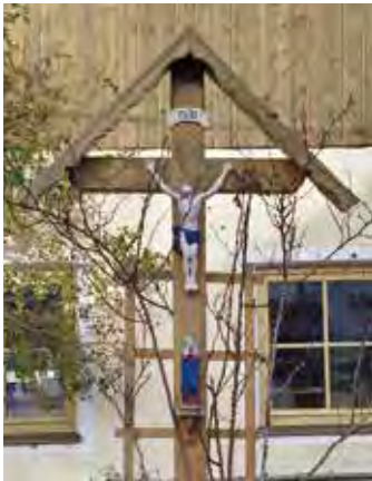
Das Bild zeigt das Kreuz im Januar 2020

Das Kreuz steht in Holzhäuseln vor dem Dichtl-Hof. Das Kreuz steht an der Straße von Endorf nach Holzhäuseln und St. Christoph. Es befindet sich vor dem Gartenzaun des erhöht gelegenen Dichtlhofes. Im Sommer ist es immer von vielen Blumen umgeben.